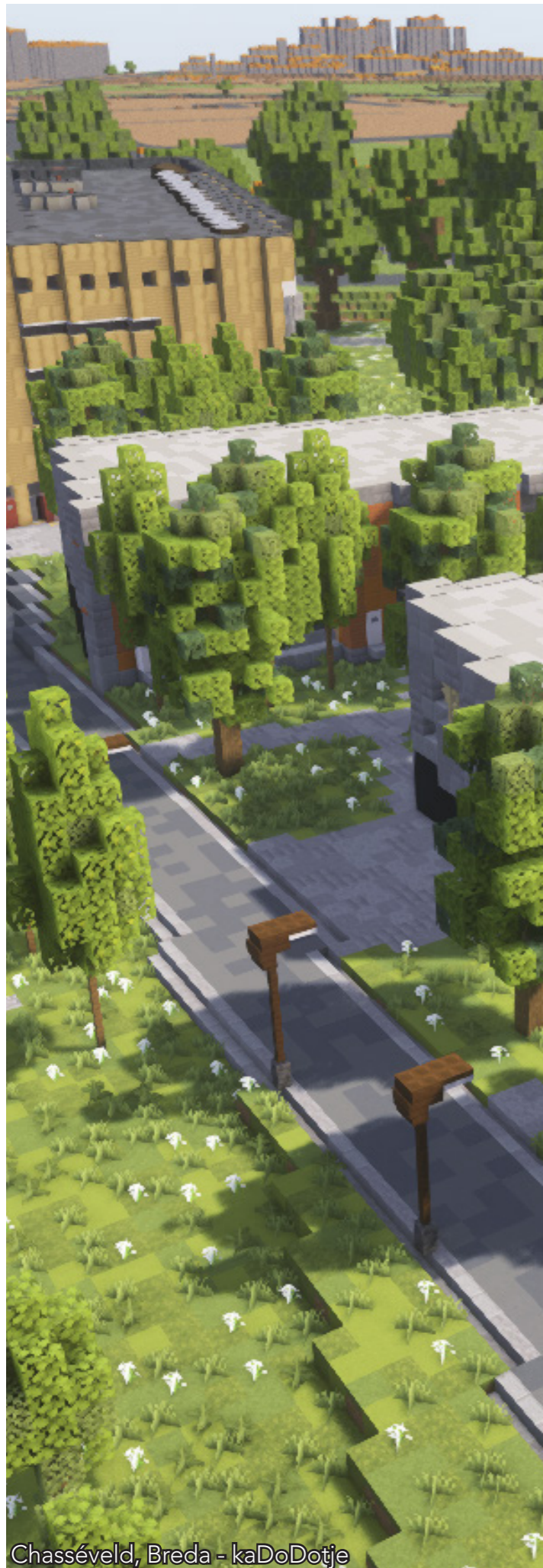
Chasséveld, Breda - kaDoDotje GeoEditie © 2025 - kaDoDotje