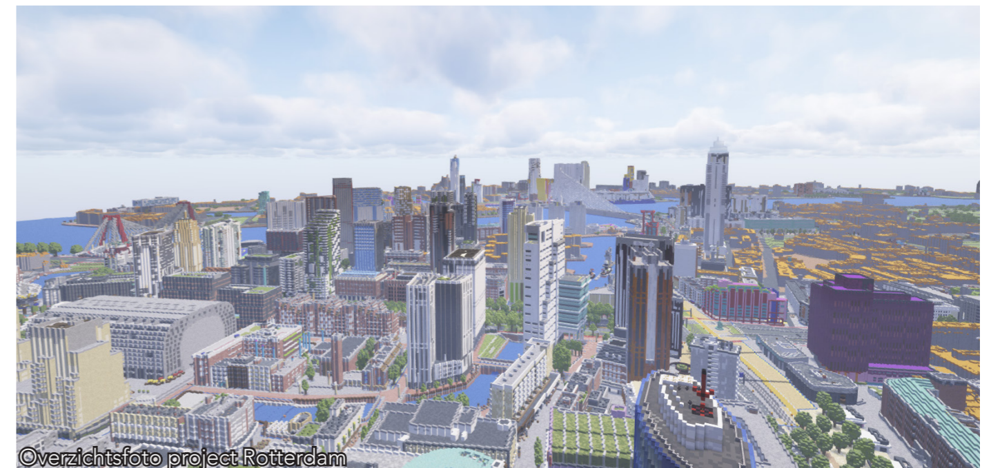
Overzichtsfoto project Rotterdam

Of Rotterdam ooit klaar zal zijn? Waarschijnlijk niet. Maar zolang spelers als Tibbe blijven bouwen, blijft de stad groeien. Blok voor blok. Jaar na jaar.