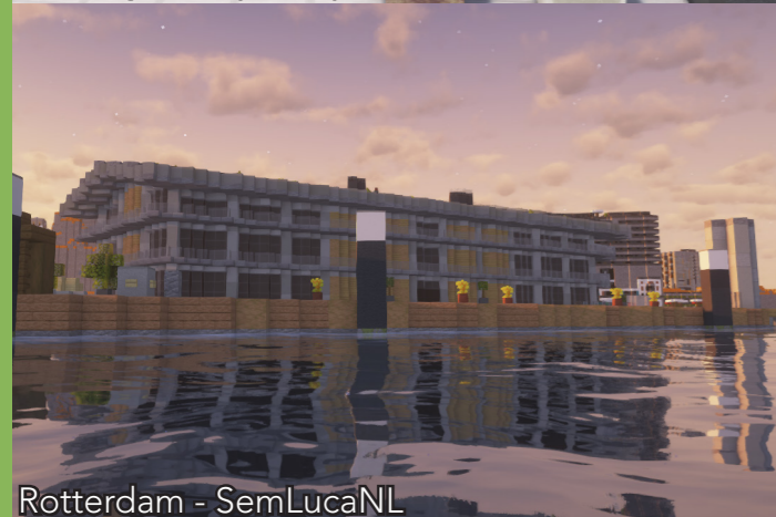
Rotterdam - SemLucaNL