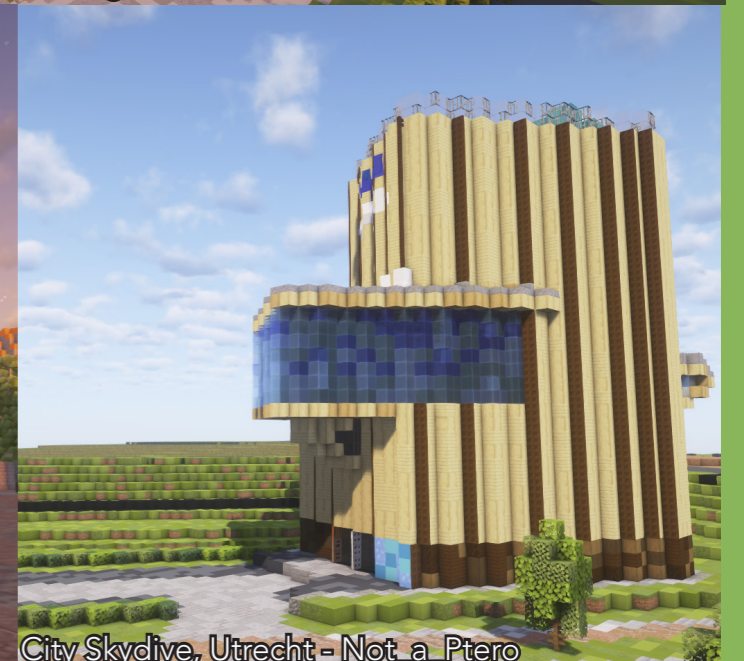
City Skydive, Utrecht - Not_a_Ptero