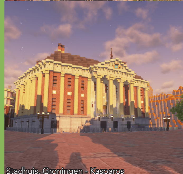
Stadhuis, Groningen - Kasparos