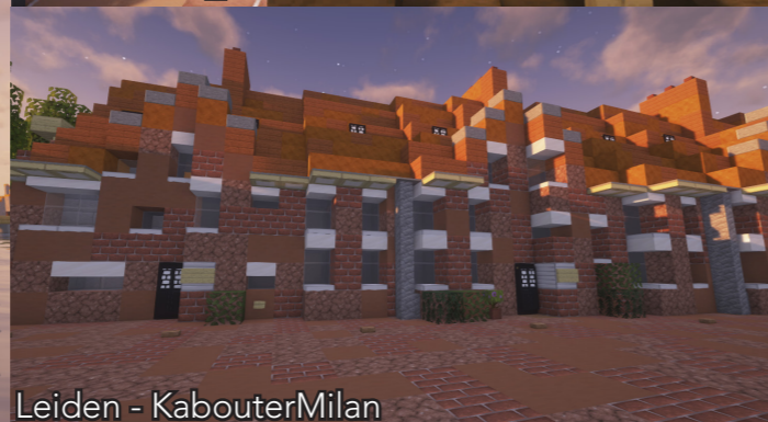
Leiden - KabouterMilan