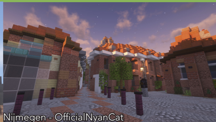
Nijmegen - OfficialNyanCat