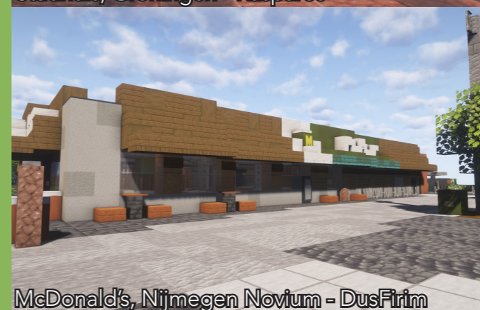
McDonald's, Nijmegen Novium - DusFirm