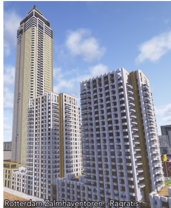
Rotterdam Zalmhaventoren - Ragratis

maanden vrijwel alles zelf gedaan. Elk gebouw, elke stoep, elk detail.”