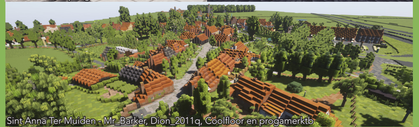
Sint Anna Ter Muiden