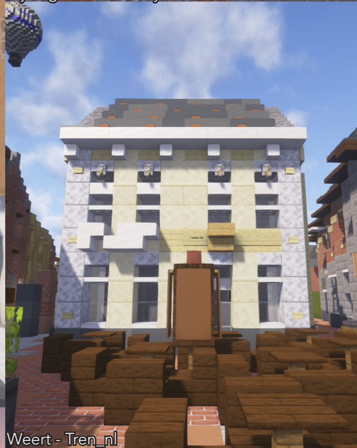
Weert - Tren_nl