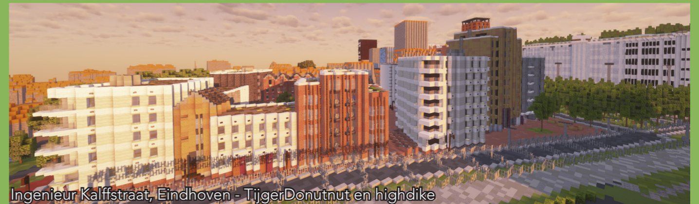
Ingenieur Kalfstraat, Eindhoven - TijgerDonutnut en highdike