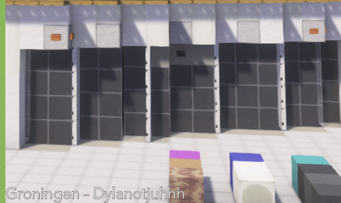
Groningen - Dylanotjuhh